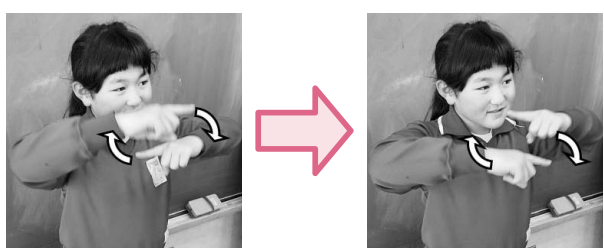
両手の人差し指を向かい合わせにして上下に置き垂直に交互に回します。