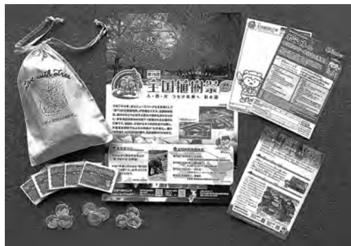
市が作成した各種啓発物品 (一部)

普及啓発事業については、市町村独自で実施しているものもあります。これまで市では、主に次の事業を行ってきました。