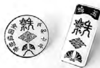
秩父地域オリジナルピンバッジ (右は非売品です)

第75回全国植樹祭のことをもっと多くの方に知っていただくため、身近に感じていただくため、委員会の中核組織である「推進協議会」では、既存のイベントやお祭り等でのPR、秩父地域オリジナルピンバッジ(有償)やリーフレット、ステッカー、ポスターなどの各種啓発物品の作成・配付を行っています。